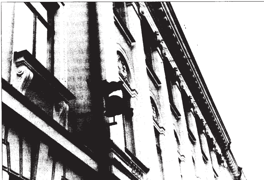
Valvonnan estetiikka / Pressan linna

amassa ja kyky lukea ja ymmärtää kaupunkia, sekä suunnistaa siellä, käy yhä vaikeammaksi (Jameson 1986:240, 275).