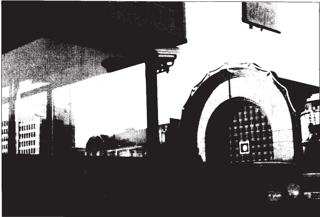
Kamerat / Helsingin julkinen tila

Tietyn, useimmiten melko varakkaan, asuinalueen asukkaat järjestävät vartiointivuoroja ja partioivat alueellaan. Korttelivalvontaa voidaan pitää eräänlaisena urbaanin yhteisöllisyyden muotona. Periaatteessa se perustuu siihen, että ihmiset välittävät toisistaan ja katsovat mitä asuinalueella tapahtuu. Korttelivalvonnan käsite on kuitenkin hyvin ambivalentti. Juuri sen tyyppisellä toiminnalla on vaarana johtaa territoriaaliseen rasismiin. Omasta naapurustosta välittämisen ja territoriaalisen rasismin välinen raja on hämärä. Esimerkiksi afrikkalaisissa kaupungeissa korttelipartiot ovat tavallisia pääosin valkoisten asuttamilla alueilla. Niiden toimintamuodot ovat usein hyvin väkivaltaisista (aseita käytetään suruttomasti), ja toiminta johtaa helposti kaupungin jakautumiseen "valkoisiin" ja "mustiin" alueisiin. Virallisen apartheidin murtuessa rotuerottelua uusinnetaan vapaaehtoisvoimin.