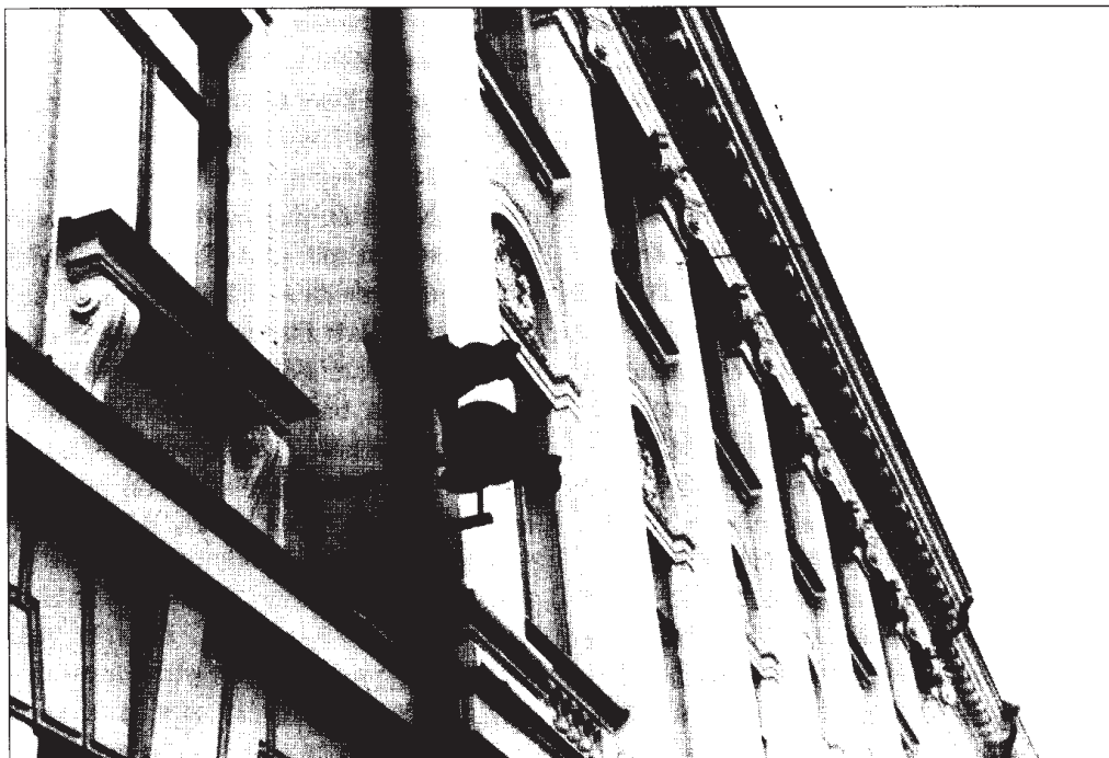
Valvonnan estetiikka / Pressan linna

amassa ja kyky lukea ja ymmärtää kaupunkia, sekä suunnistaa siellä, käy yhä vaikeammaksi (Jameson 1986:240, 275).