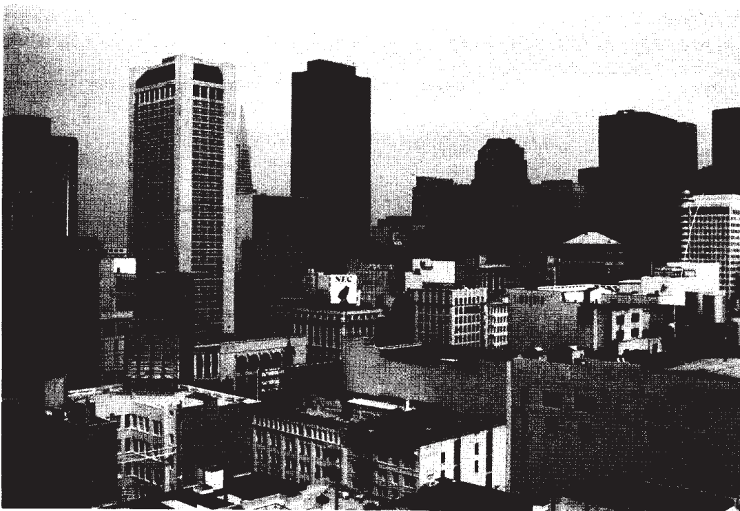
Kuva 1. San Franciscon keskusta, kaupunkikuva

Kahden miljoonan asukkaan St.Louisin kehitys on tästä hyvä esimerkki. Sata vuotta sitten St.Louis kilpaili keskilännen johtoasemasta Chicagon kanssa. Sen edullinen sijainti Mississippijoen varrella ja useiden länteen suuntautuneiden