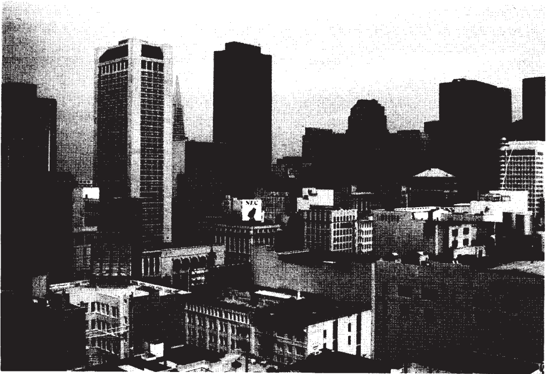
Kuva 1. San Franciscon keskusta, kaupunkikuva

Kahden miljoonan asukkaan St.Louisin kehitys on tästä hyvä esimerkki. Sata vuotta sitten St.Louis kilpaili keskilännen johtoasemasta Chicagon kanssa. Sen edullinen sijainti Mississippijoen varrella ja useiden länteen suuntautuneiden