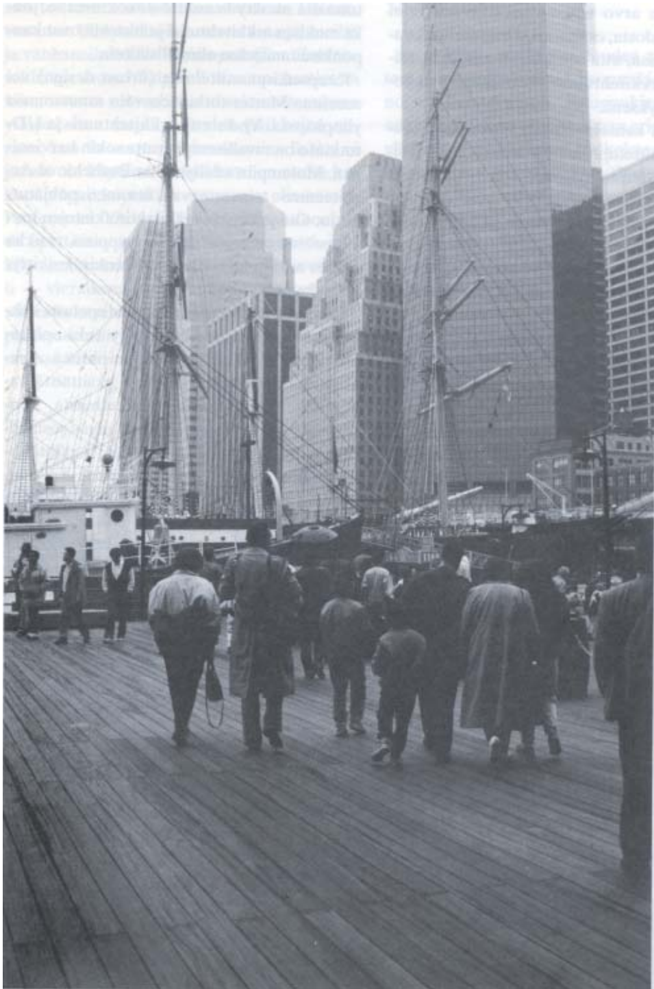
Kuva 5. New York City, South Streetin turistialue.