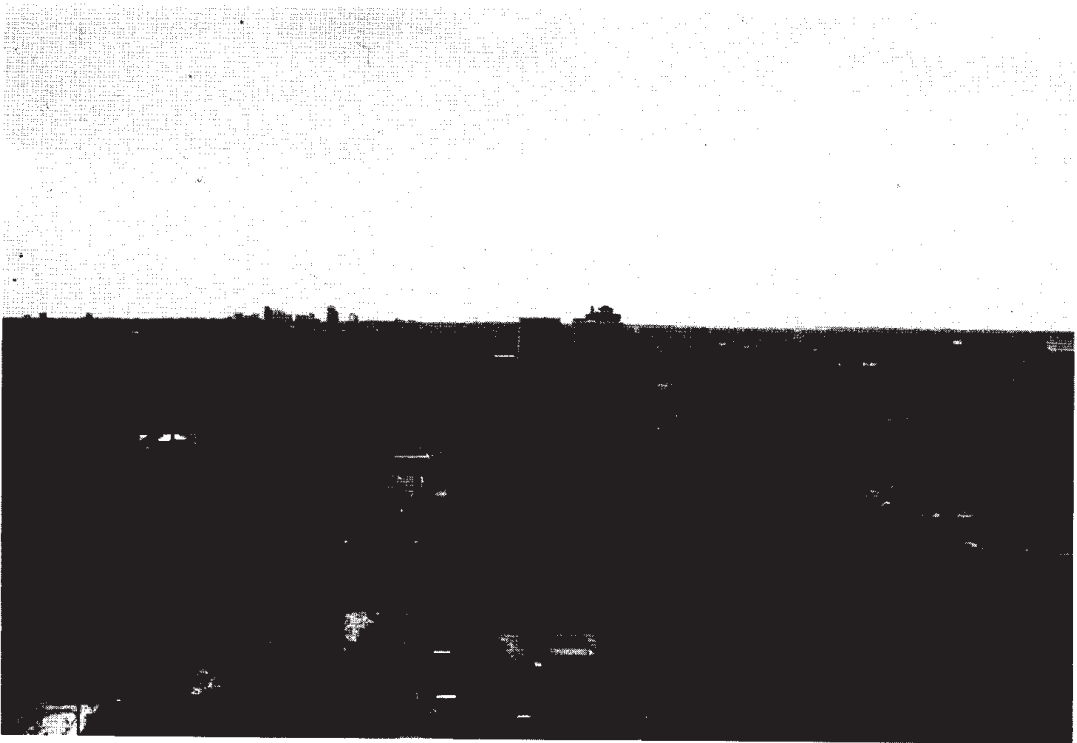
Kuva 3. St. Louis, Central West End. Horisontissa vauraiden saarekkeiden pilvenpiirtäjärykelmä.

Eurooppalaistyyppisen kaupungin katoaminen Yhdysvaltain koillisista ja suurten järvien läheisistä osavaltioista liittyy savupiipputeollisuuden vähentymiseen. Modernit tuotantolaitokset ja palvelut sijoittuvat vanhojen kaupunkien esikaupunkialueille sekä esikaupunki-