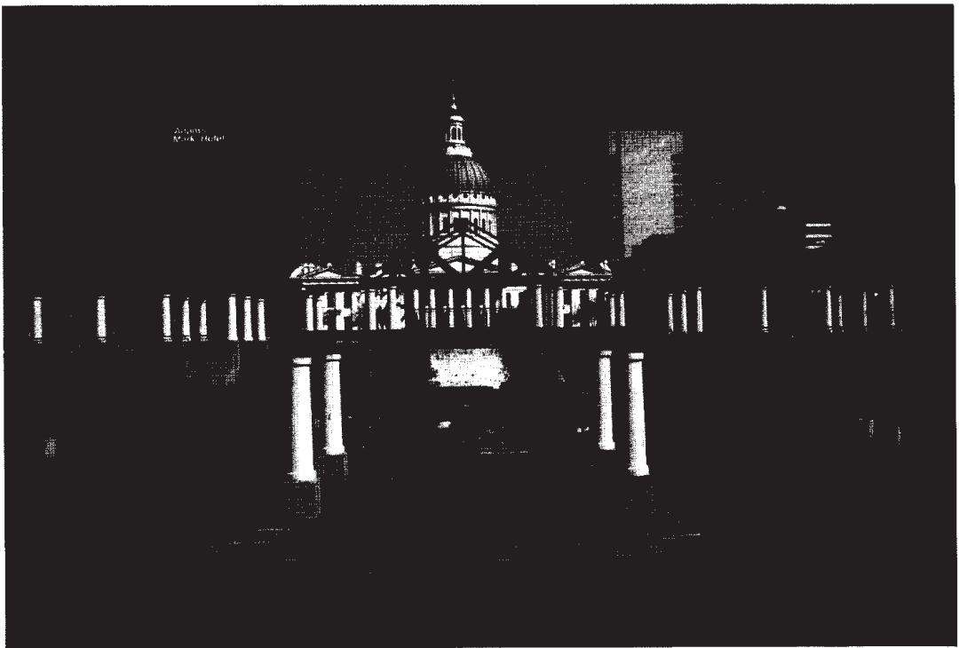
Kuva 2. St. Louisin keskusta, kaupunkisuunnittelun symboleja: Eero Saarisen Gateway, nyt museona toimiva Old Courthouse sekä vastarakennettu katos- ja vesiaihesommitelma.

Pikkukaupunkimaiset saarekkeet koostuvat asuinrakennuksista ja kaupallisista palveluis-