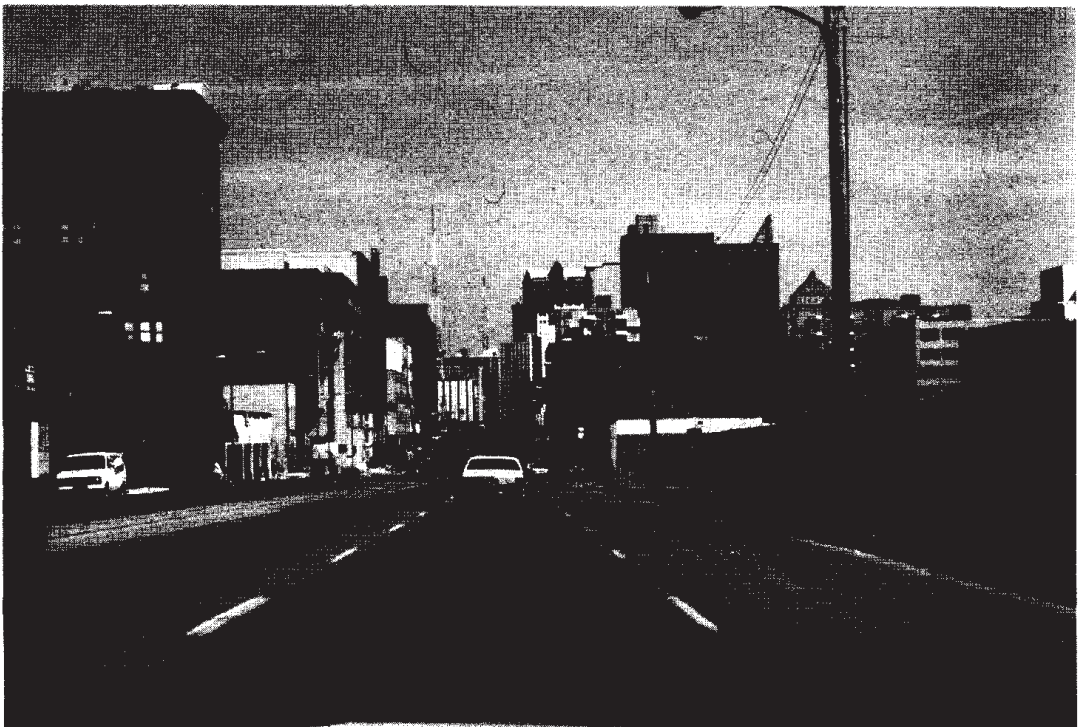
Kuva 4. St. Louis, suunnittelematonta seka-aluetta keskustan ja vauraiden saarekkeiden välillä.

Kaupungeilla on aniharvoin poliittisesti tai kaupunkirakenteellisesti päätettyjä yleiskaavoja. Rakentamista ohjataan rakennusjärjestyksen tyyppisillä alueellisilla ohjeilla (zoning regulations). Kaupungin virkamiehet toimivat yhteistyössä rakennuttajien ja rakennusliikkeiden kanssa: kaupunkia, korttelia, kiinteistöä "kehitetään" (developing). Kehittämisellä viitataan yksinomaan taloudelliseen toimin-